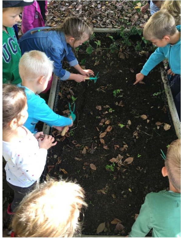
Posadili smo grah, čebulček in jesenski česen.