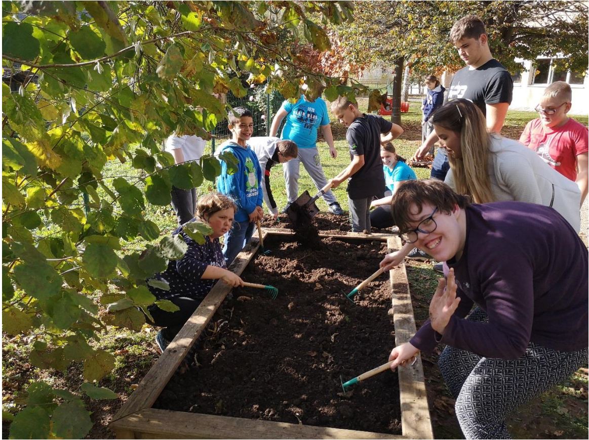
Tudi najmlajši vrtičkarji so uredili svojo gredo.